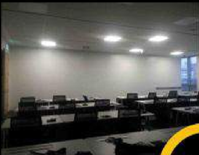
스크린크기: Max 180" (4500x4000) 빔프로젝트: 3대 동시 사용

전용 스크린 동등 수준이상의 고화질 스크린 넓고 편안한 시야각. 대형 스크린 화면에 오래보아도 눈이 편안하기 때문에 최적의 회의 환경 및 효과적인 회의가 가능 합니다.