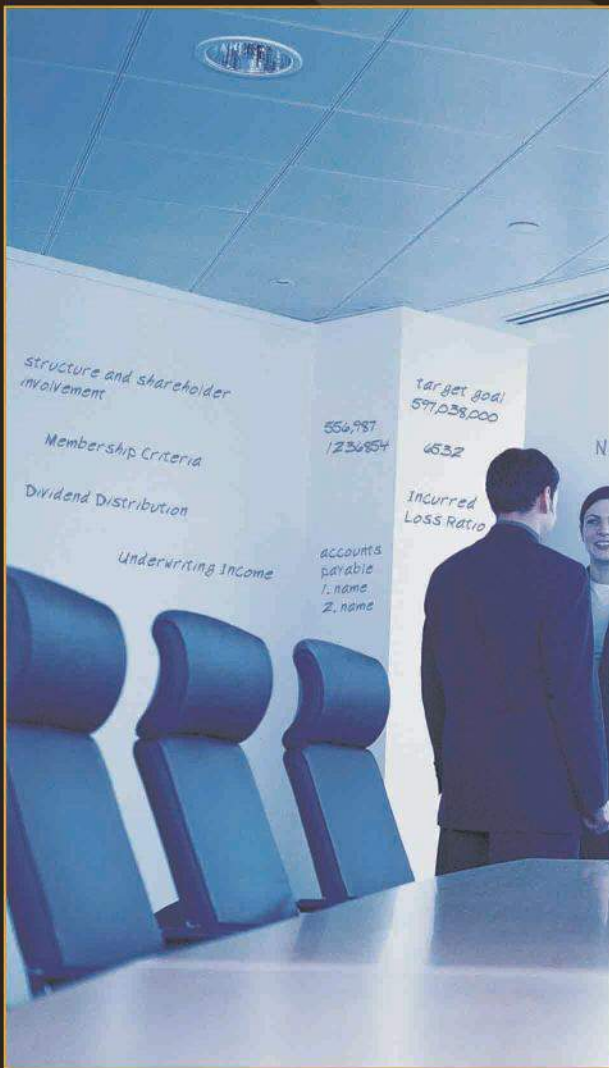
color: matte white