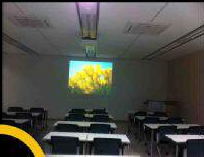
스크린크기: Max 180" (4500x4000) 빔프로젝트: 3대 동시 사용