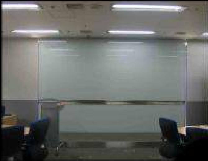
전용스크린: 120" (3000x2400) 유리보드: 1200x4800mm

회의실 용도로 사용시 랜덤 방향으로 난반사 및 빛집중이 발생되어 회의 집중력이 떨어집니다. 앉은 자리에 따라 시야각이 좋지 않아, 오래보면 눈이 쉽게 피로해 집니다.