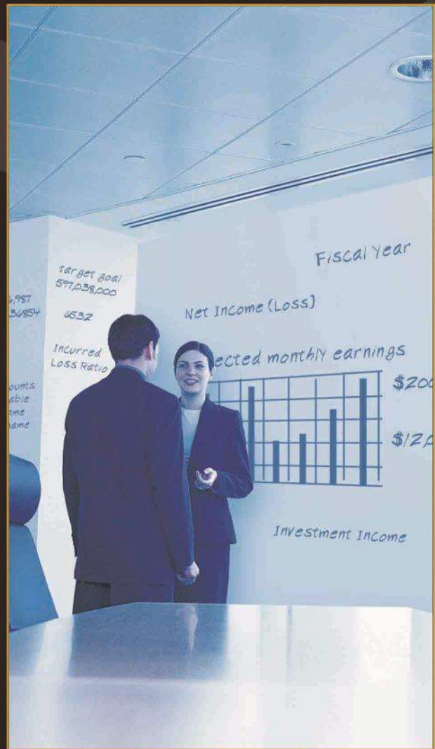
color: matte white