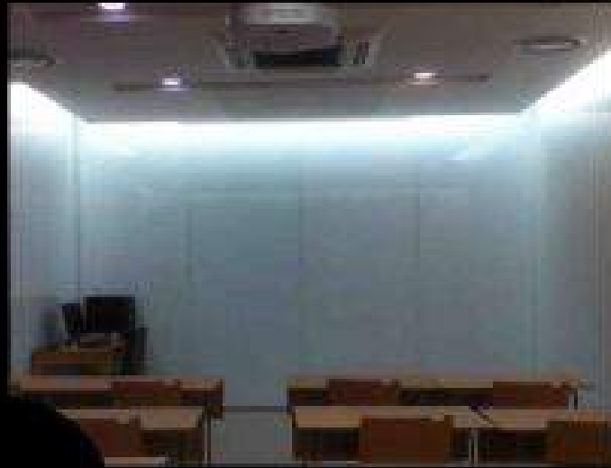
천장에 고정 빔프로젝트 1대